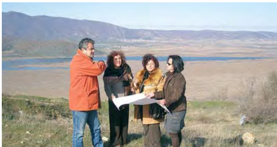
29/11/2007 ΜΕΛΕΤΗ ΓΙΑ ΤΗΝ ΑΞΙΟΠΟΙΗΣΗ ΤΗΣ ΛΙΜΝΗΣ ΧΕΙΜΑΔΙΤΙΔΑΣ