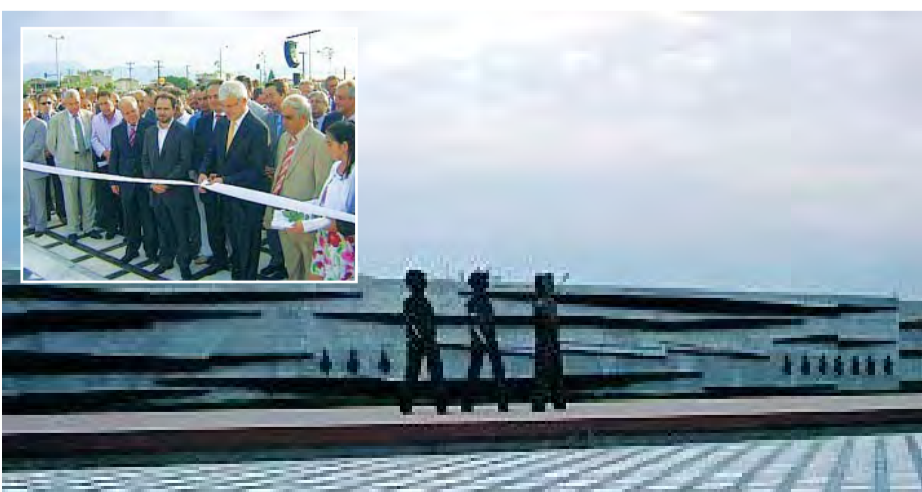
4/6/2007 Τελετή εγκαινίων του μνημείου "ΜΝΗΜΕΣ ΛΙΓΝΙΤΗ"