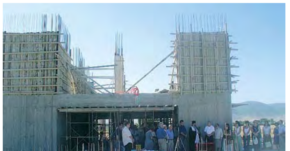
28/6/2007 ΘΕΜΕΛΙΩΣΗ 5ου ΓΥΜΝΑΣΙΟΥ