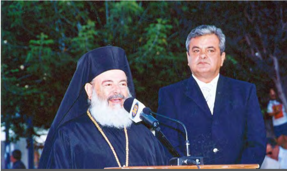
Από τη επίσκεψη του μακαριστού Χριστόδουλου στις 24 / 8 / 2004 στην Πτολεμαίδα