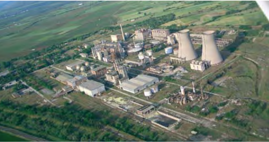
1/11/2007 ΕΝΤΟΝΗ ΔΡΑΣΤΗΡΙΟΤΗΤΑ ΣΤΟ ΒΙΟΜΗΧΑΝΙΚΟ ΠΑΡΚΟ (ΒΙΟ.ΠΑ.Π)