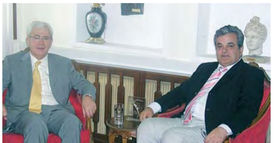
23/6/2008 Συνάντηση Δημάρχου Πτολεμαΐδας με τον Πρόεδρο της ΔΕΗ Κ. ΑΘΑΝΑΣΟΠΟΥΛΟ