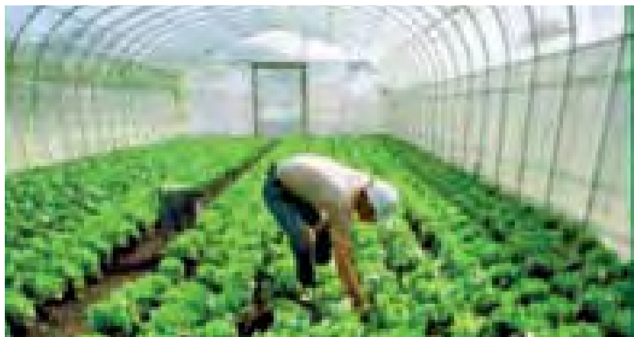
11/12/2007 ΙΔΡΥΣΗ ΖΩΝΗΣ ΕΓΚΑΤΑΣΤΑΣΗΣ ΘΕΡΜΟΚΗΠΙΩΝ (ΖΕΘ) ΠΤΟΛΕΜΑΪΔΑΣ ΣΕ ΕΚΤΑΣΕΙΣ ΤΗΣ ΠΡΩΗΝ ΛΙΠΑΣΜΑΤΟΒΙΟΜΗΧΑΝΙΑΣ ΛΕΒΑΛ