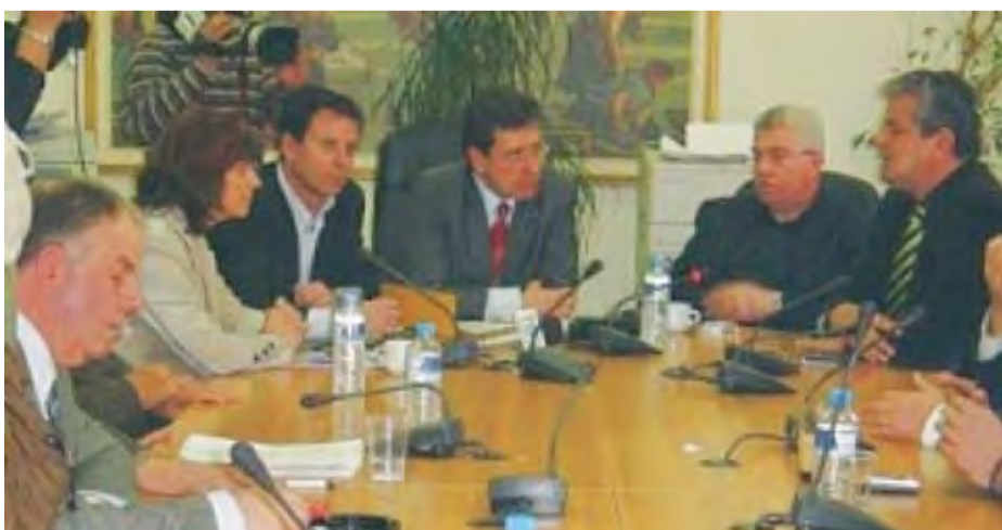
22/3/2007 Υπεγράφη η σύμβαση κατασκευής του δρόμου Δυτικής Εορδαίας.