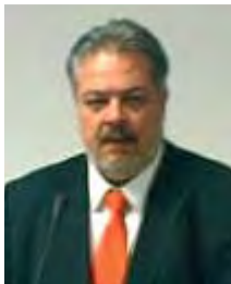
Γ.Γ. Περιφέρειας Ανδρέας Λεούδης

Δελτίο τύπου Περιφέρειας Δυτ. Μακεδονίας