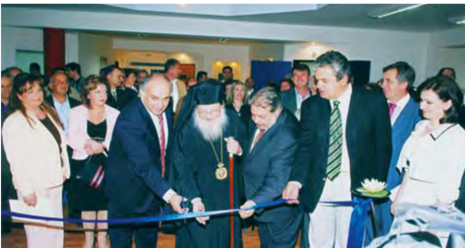
24/5/2007 Εγκαίνια πύλης ανοιχτού πανεπιστημίου