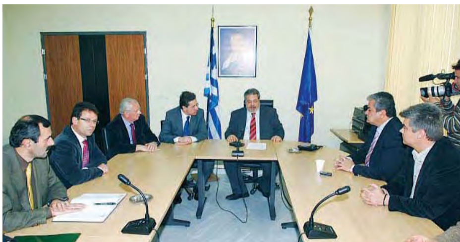
18/4/2007 ΥΠΕΓΡΑΦΗ Η ΣΥΜΒΑΣΗ ΚΑΤΑΣΚΕΥΗΣ ΤΟΥ ΜΟΥΣΙΚΟΥ ΣΧΟΛΕΙΟΥ ΠΤΟΛΕΜΑΪΔΑΣ

15/1/2007 Από Στοιχεία της Ε.Ε.Τ.Α. (Ελληνική Εταιρεία Τοπικής Αυτοδιοίκησης)