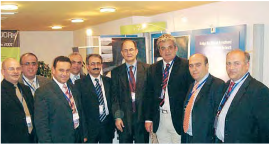
18/5/2007 ΒΡΥΞΕΛΛΕΣ Στις 40 κορυφαίες προτάσεις παγκοσμίως Η πρόταση της ΤΕΔΚ Κοζάνης για την Ευρωζωνικότητα