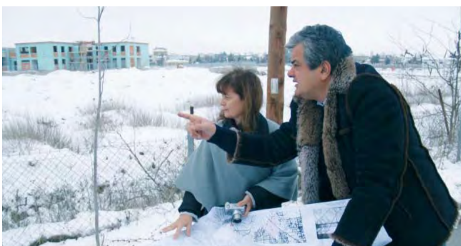
7/2/2007 ΑΝΟΙΓΕΙ Ο ΔΡΟΜΟΣ ΓΙΑ ΤΗΝ ΑΝΕΓΕΡΣΗ ΤΟΥ ΔΙΚΑΣΤΙΚΟΥ ΜΕΓΑΡΟΥ ΣΤΗΝ ΠΤΟΛΕΜΑΪΔΑ