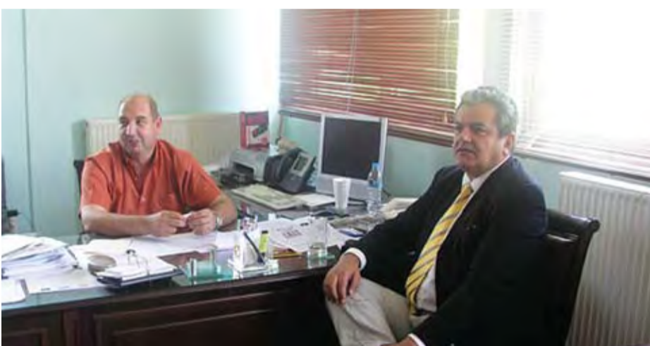
1/6/2007 Αναγγελία ίδρυσης Σχολής ΤΕΙ Μαιευτικής στην Πτολεμαΐδα