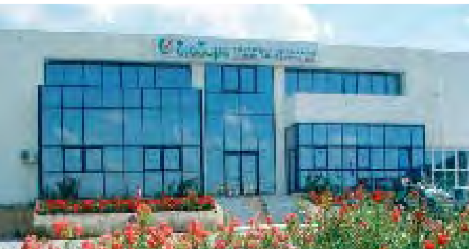
13/11/2007 ΣΤΟ Δ.Σ. ΤΗΣ ΔΙΑΔΥΜΑ Α.Ε. Ο ΔΗΜΟΣ ΠΤΟΛΕΜΑΪΔΑΣ