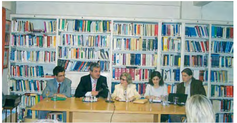
14/6/2007 Ο ΔΗΜΑΡΧΟΣ ΠΤΟΛΕΜΑΪΔΑΣ ΠΡΟΣΚΕΚΛΗΜΕΝΟΣ ΣΤΗ ΣΥΝΕΝΤΕΥΞΗ ΤΥΠΟΥ ΤΟΥ ΙΔΡΥΜΑΤΟΣ ΜΑΡΑΓΚΟΠΟΥΛΟΥ