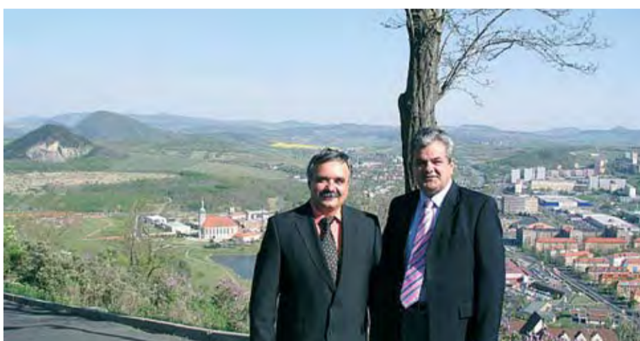
26/4/2007 ΣΤΗΝ ΑΔΕΛΦΟΠΟΙΗΜΕΝΗ ΠΟΛΗ ΜΟΣΤ ΤΗΣ ΤΣΕΧΙΑΣ