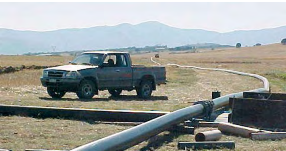
7/11/2007 ΜΕ ΕΝΤΑΤΙΚΟΥΣ ΡΥΘΜΟΥΣ ΣΥΝΕΧΙΖΕΤΑΙ ΤΟ ΕΡΓΟ ΓΙΑ ΤΗΝ ΥΔΡΕΥΣΗ ΤΟΥ ΠΕΡΔΙΚΚΑ