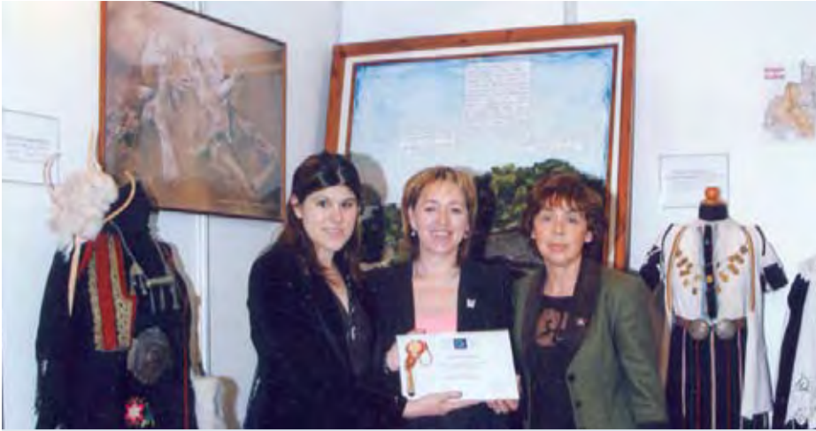
9/5/2007 ΕΙΔΙΚΟ ΒΡΑΒΕΙΟ ΑΠΕΣΠΑΣΕ Ο ΔΗΜΟΣ ΠΤΟΛΕΜΑΪΔΑΣ ΓΙΑ ΤΗ ΣΥΜΜΕΤΟΧΗ ΤΟΥ ΣΤΗΝ ΕΚΘΕΣΗ ΕΛΛΗΝΙΚΟΣ ΛΑΪΚΟΣ ΠΟΛΙΤΙΣΜΟΣ