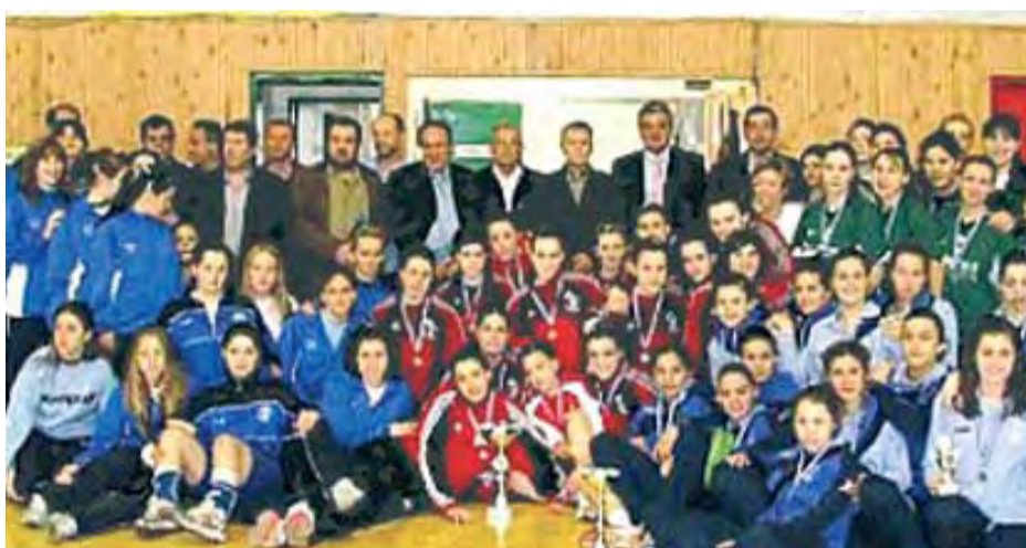
17/4/2007 ΑΡΙΣΤΑ ΣΤΟ ΔΗΜΟ ΠΤΟΛΕΜΑΪΔΑΣ ΓΙΑ ΤΗΝ ΠΑΝΕΛΛΗΝΙΑ ΔΙΟΡΓΑΝΩΣΗ ΤΗΣ ΤΕΛΙΚΗΣ ΦΑΣΗΣ ΧΑΝΤ-ΜΠΟΛ (Νεανίδων - Κορασίδων)