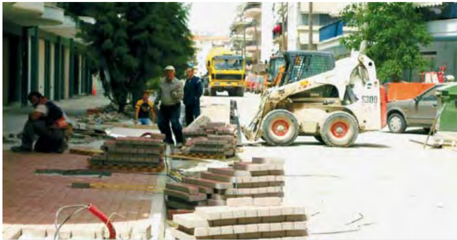
30/3/2007 ΕΡΓΑ ΑΝΑΠΛΑΣΗΣ ΣΤΗΝ ΟΔΟ ΝΟΣΟΚΟΜΕΙΟΥ ΚΑΙ ΤΩΝ ΠΑΡΑΠΛΕΥΡΩΝ ΣΕ ΑΥΤΗΝ ΟΔΩΝ.