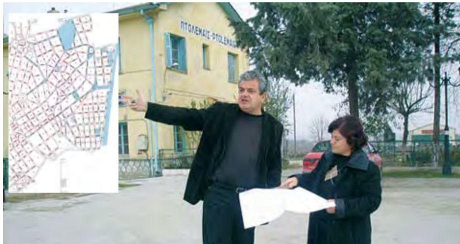
23/11/2007 Ήρθε η ώρα για την αναβαθμιση της Κάτω Πτολεμαΐδας