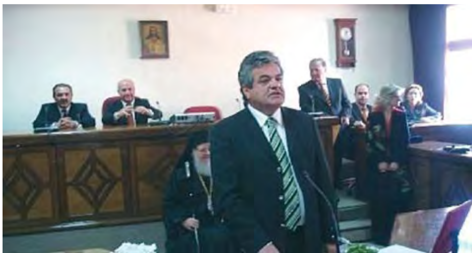
1/1/2007 ΟΡΚΩΜΟΣΙΑ ΤΟΥ ΔΗΜΑΡΧΟΥ ΚΑΙ ΤΟΥ ΝΕΟΥ ΔΗΜΟΤΙΚΟΥ ΣΥΜΒΟΥΛΙΟΥ ΠΤΟΛΕΜΑΪΔΑΣ