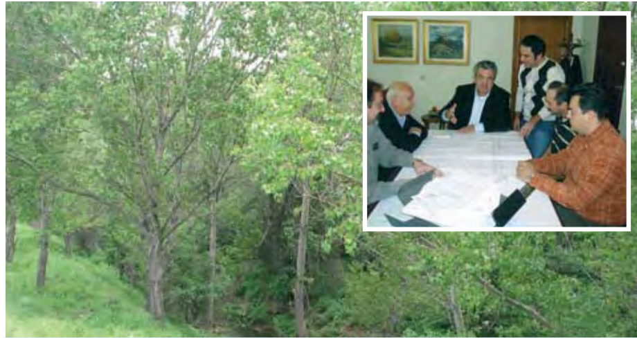
19/11/2007 ΞΕΚΙΝΑΕΙ ΤΟ ΕΡΓΟ ΑΞΙΟΠΟΙΗΣΗΣ ΤΟΥ ΠΟΤΑΜΟΥ ΣΟΥΛΟΥ