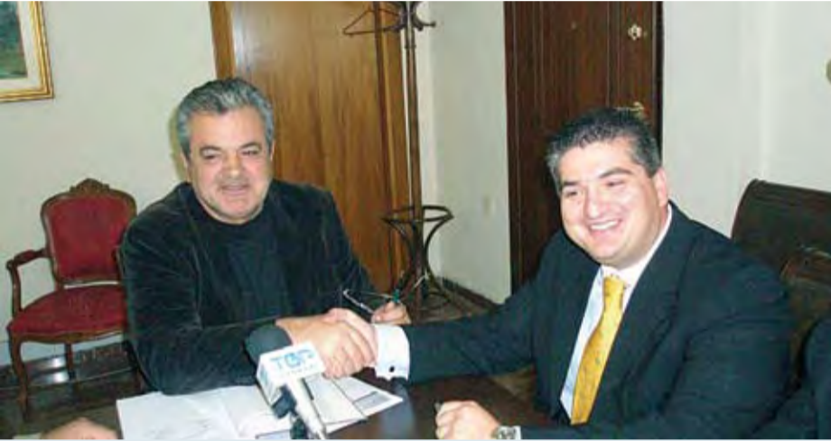
2/11/2007 ΥΠΕΓΡΑΦΗ Η ΣΥΜΒΑΣΗ ΓΙΑ ΤΟ ΜΗΤΡΟΠΟΛΙΤΙΚΟ ΔΙΚΤΥΟ ΟΠΤΙΚΩΝ ΙΩΝ