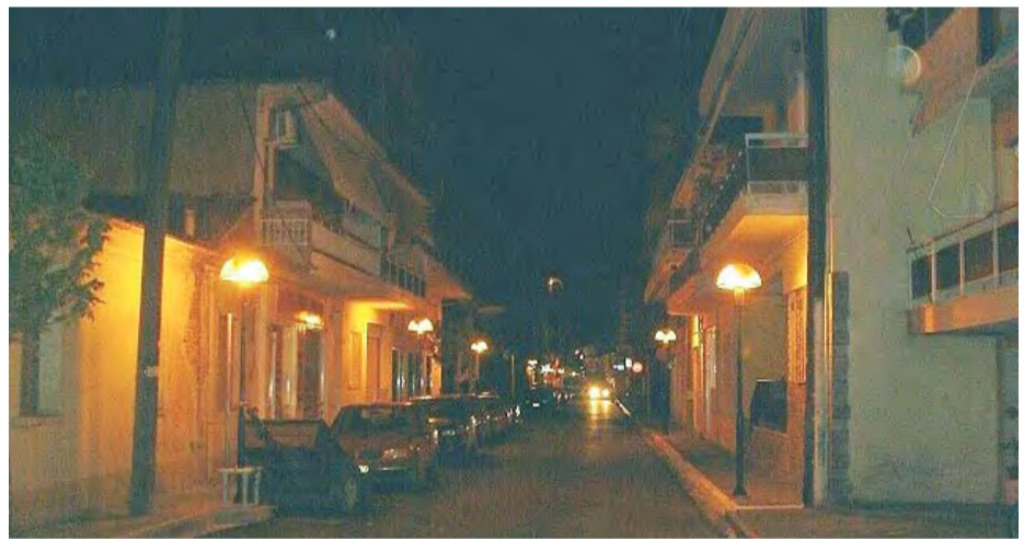
18/6/2007 ΑΝΑΠΛΑΣΗ ΤΗΣ ΟΔΟΥ ΠΤΟΛΕΜΑΙΩΝ