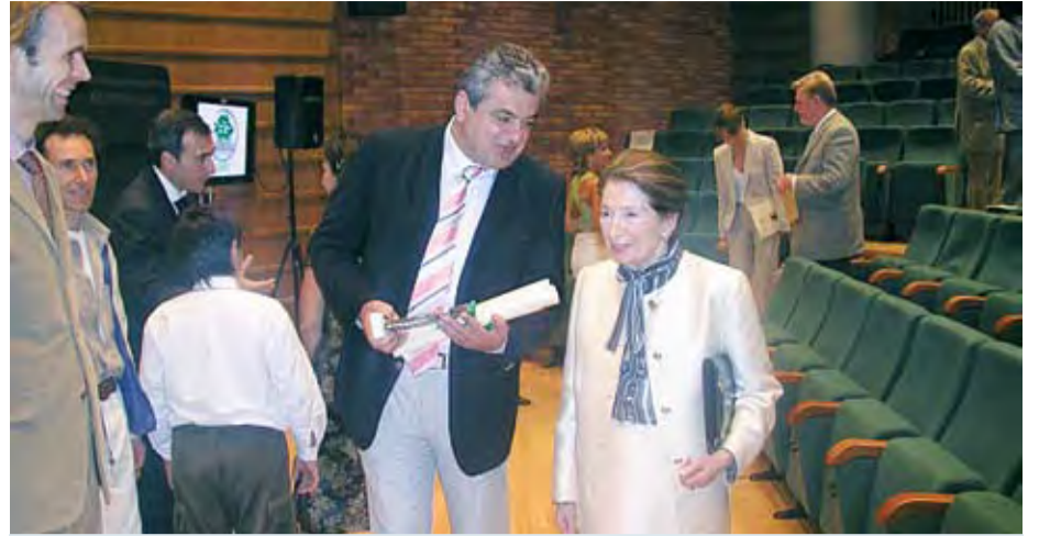
8/6/2007 ΠΡΩΤΟ ΒΡΑΒΕΙΟ ΟΙΚΟΠΟΛΙΣ (ΠΕΡΙΒΑΛΛΟΝΤΙΚΗΣ ΕΥΑΙΣΘΗΣΙΑΣ) ΣΤΗΝ ΤΗΛΕΘΕΡΜΑΝΣΗ ΠΤΟΛΕΜΑΪΔΑΣ