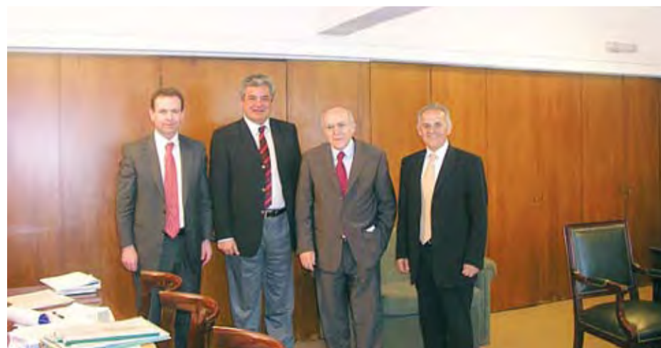
8/5/2007 ΓΕΝΝΑΙΑ ΧΡΗΜΑΤΟΔΟΤΗΣΗ ΣΟΥΦΛΙΑ ΓΙΑ ΤΗΛΕΘΕΡΜΑΝΣΗ ΚΑΙ ΣΟΥΛΟΥ ΣΤΟ ΔΗΜΟ ΠΤΟΛΕΜΑΪΔΑΣ